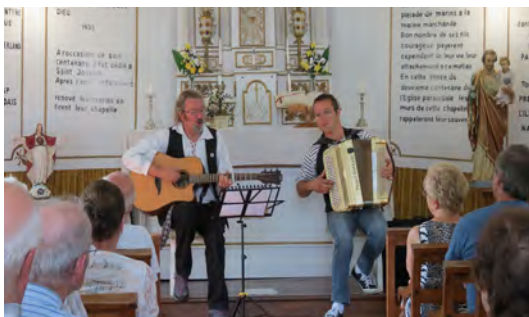
Babord Tribord à la Chapelle des marins