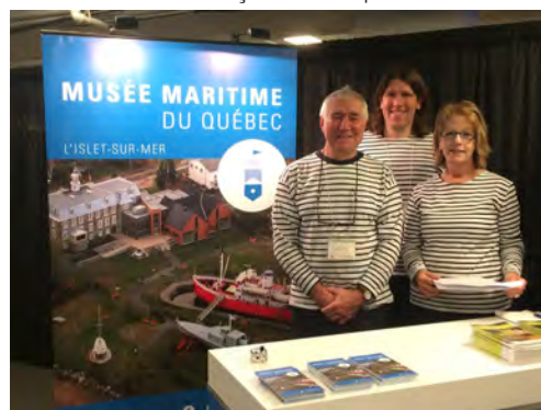
Équipe du musée présente au Salon

Nous avons pour l'occasion organisé un concours pour gagner un panier de la Boutique d'une valeur de 700$. Chacun des 3 043 visiteurs a reçu un encart promotionnel.