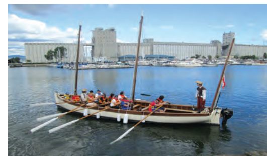
Canot 19 lors des Fêtes de la Nouvelle-France à Québec