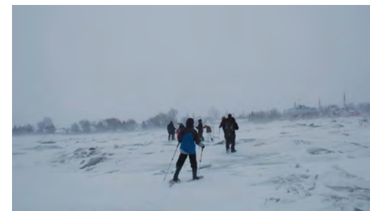
La marche polaire

Le musée s'est joint aux activités de la Fête d'hiver pour une première année en proposant une marche sur la batture, avec un départ du musée jusqu'au Rocher Panet pour une interprétation de sa légende et de la géologie du site environnant. Environ une vingtaine de personnes ont bravé un froid polaire, les 12, 13 et 14 février 2016, aux heures de marée basse.