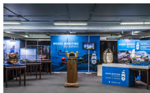
Kiosque au Salon du bateau