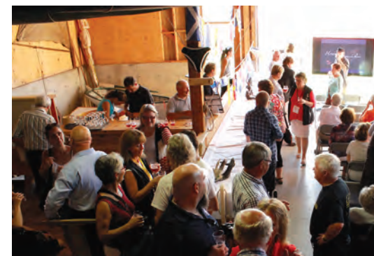
Photo prise lors de l'Hommage aux gens du fleuve

L'évènement qui a été initié en 2007 a depuis honoré plus d'une quinzaine de personnes ou d'organismes significatifs de la vie maritime québécoise, tant au niveau local que national.