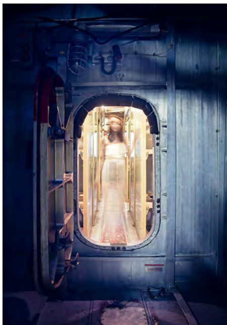
Publicité écran numérique

Cette activité a contribué au renforcement du lien avec la communauté avec l'implication de nombreux bénévoles.